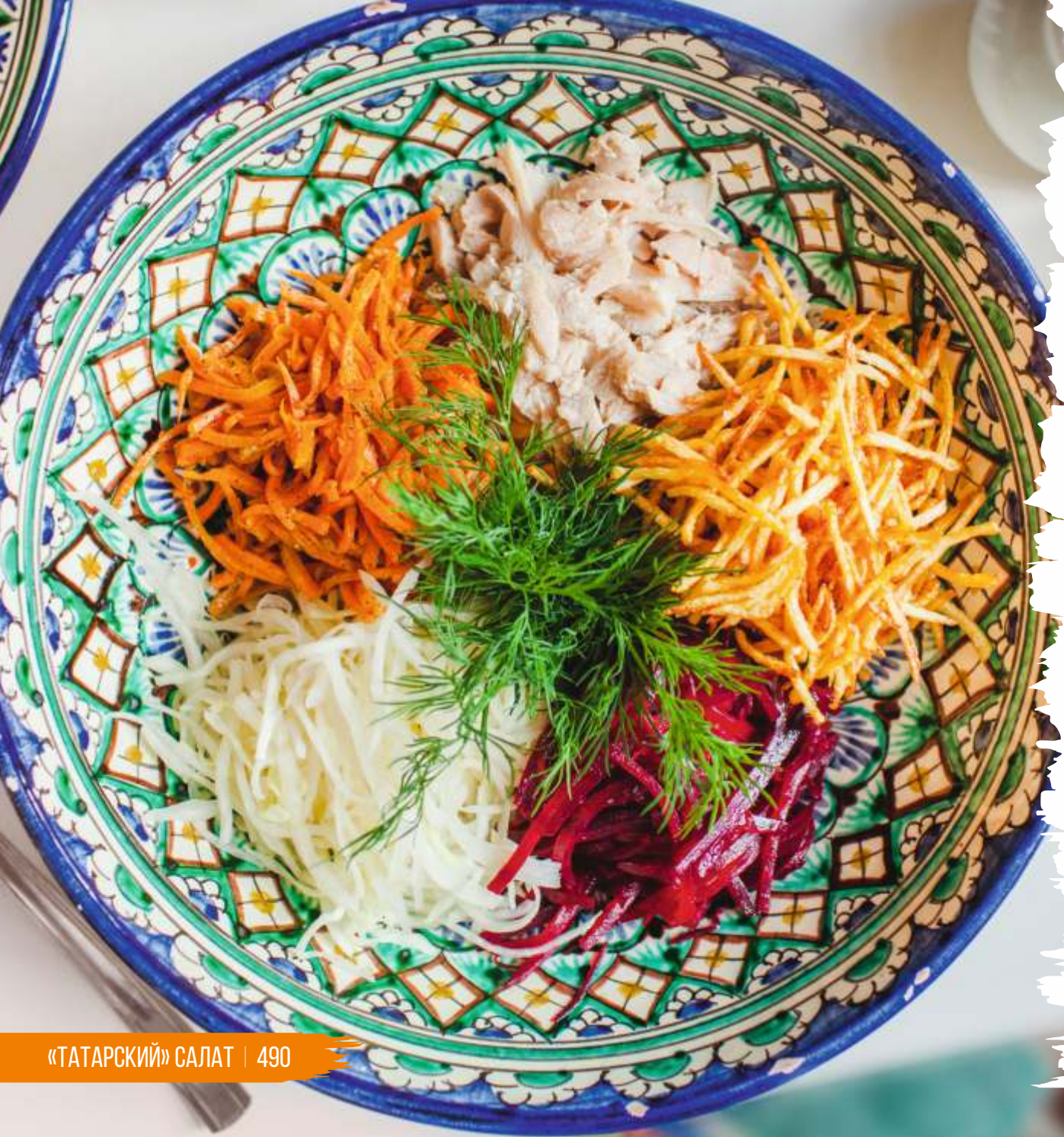
«ТАТАРСКИЙ» САЛАТ | 490