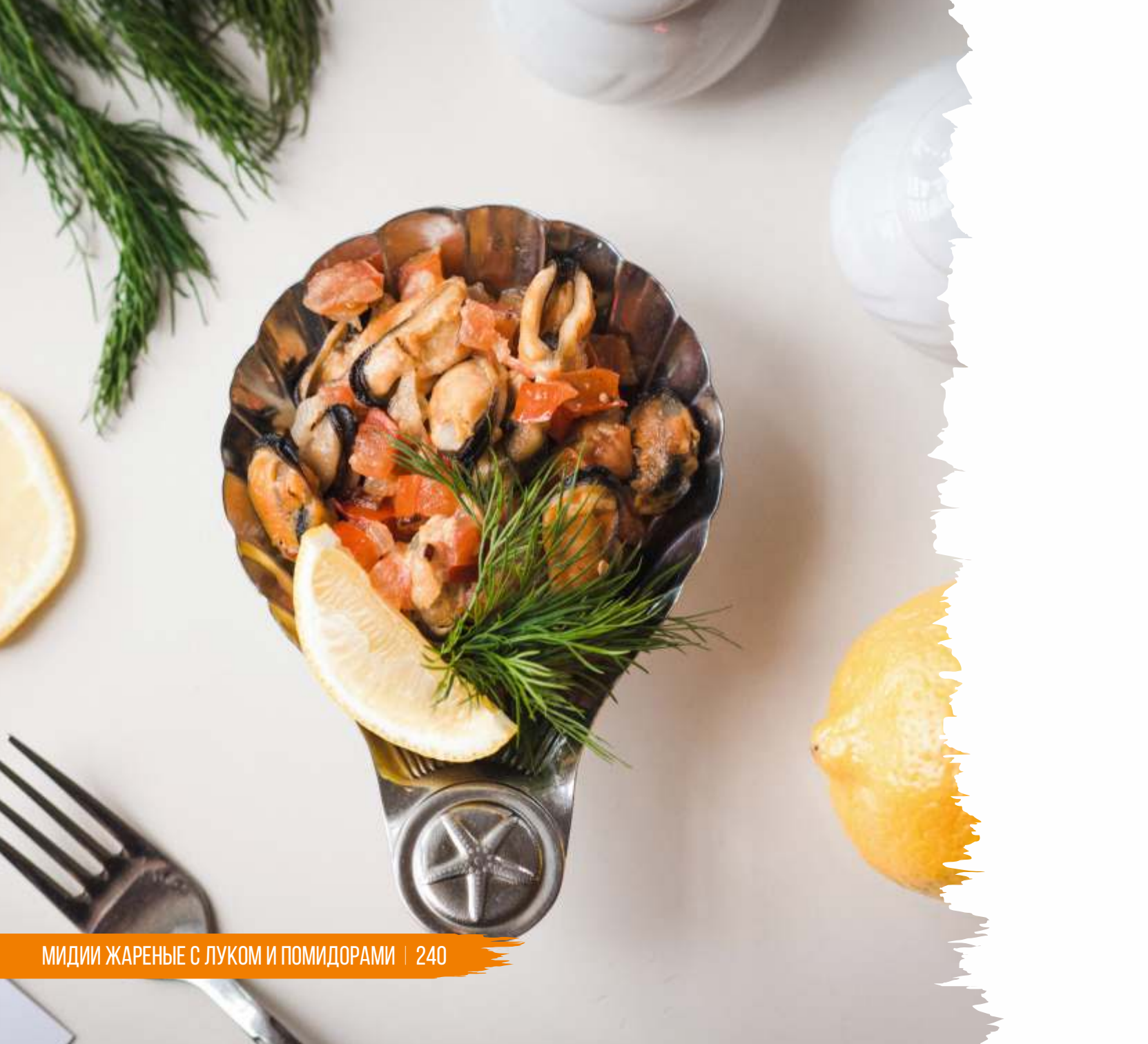
МИДИИ ЖАРЕННЫЕ С ЛУКОМ И ПОМИДОРАМИ | 240