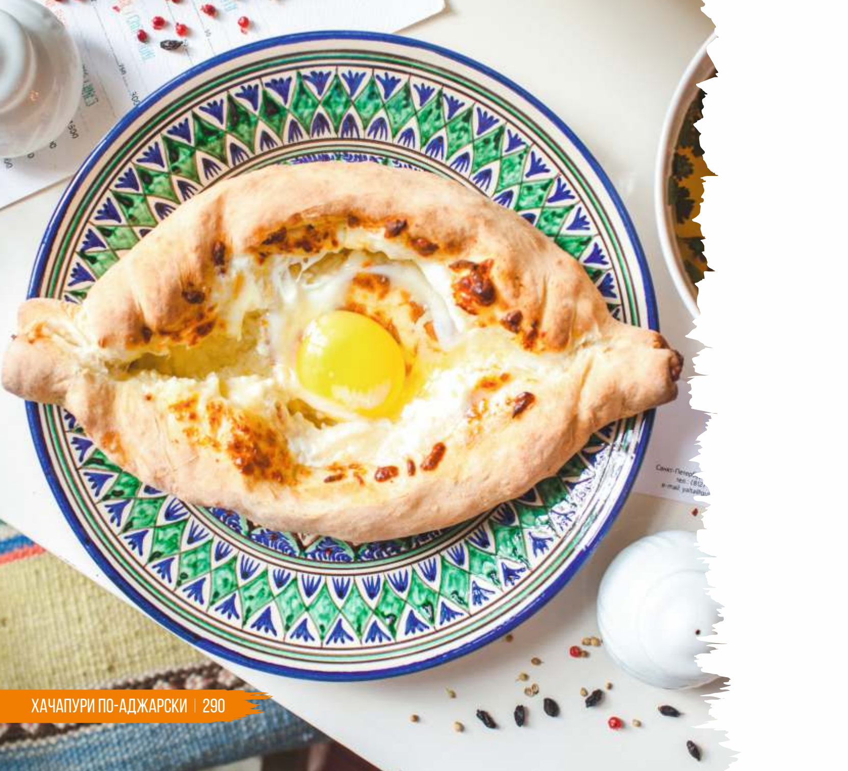
ХАЧАПУРИ ПО-АДЖАРСКИ | 290

Савно-Плето телефон: 8800 e-mail: paltan@