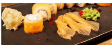
Ролл «Филадельфия» классик»