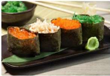
Суши Икура Икра красная