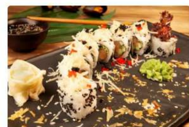
Ролл «Цезарь с лососем»

Лосось, Пармезан, огурец, кунжут, тобико, лист салата, соус «Цезарь»