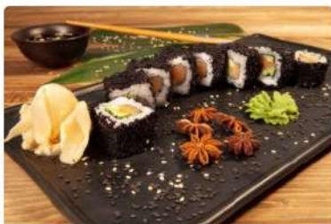
Ролл Калифорния с лососем

Лосось, авокадо, огурец, тобико, майонез