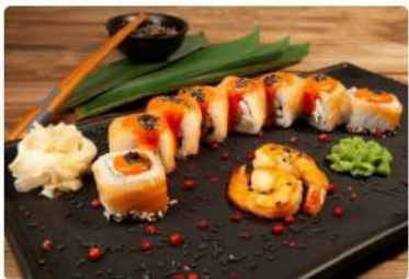
Ролл «Аляска Манго»

Лосось, снежный краб, сыр сливочный, тобико, соус «Манго», огурец