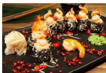
Ролл «Цезарь с креветкой»

Креветка, Пармезан, огурец, кунжут, тобико, лист салата, соус «Цезарь»