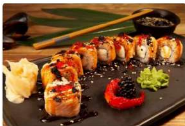
Ролл Опаленная филадельфия

Лосось, сливочный сыр, тобико, соус Терияки, кунжут