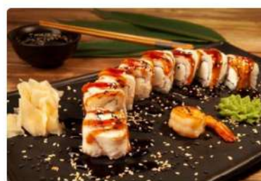
Ролл «Филадельфия» с угрем»

Угорь, сыр сливочный, соус Терияки, кунжут, тобико