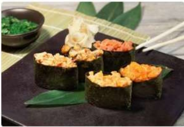
Спайс Унаги Угорь, соус спайс