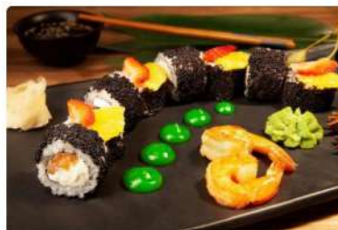
Ролл «Леди Блэк»

Лосось, сливочный сыр, тобико, апельсин, клубника, соус «Васаби»