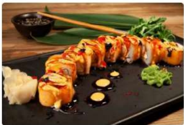
Ролл Сяке Эби Фурай

Лосось, креветка темпура, майонез, тобико, руккола, соус Спайси, соус Терияки