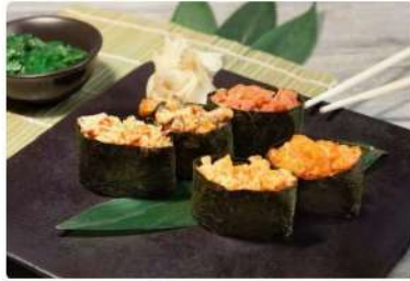
Спайс Магуро Тунец, спайс соус