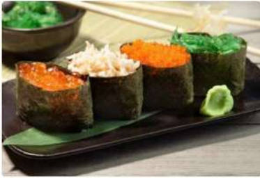
Суши Чуко Маринованные водоросли