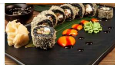
Ролл Блэк Хот

Лосось, угорь, сливочный сыр, авокадо, огурец, соус манго, соус терияки, кляр