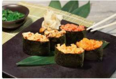
Спайс Кани Краб, соус спайс