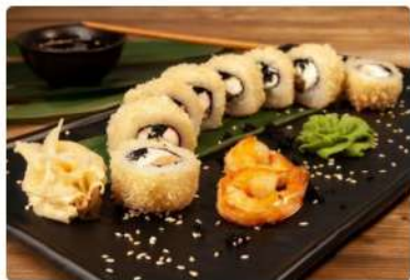
Ролл «Сяке Темпура»

Лосось, снежный краб, сливочный сыр, тобико, клар