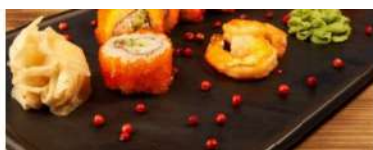
Ролл Калифорния с крабом

Филе камчатского краба, авокадо, огурец, тобико, майонез